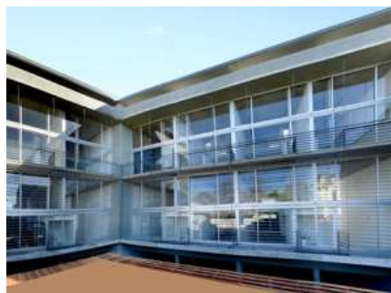
Ruíz Huidobro 3450/62 / 2H Arquitectos

"Prêmios de Arquitetura da Cidade de Buenos Aires - 2009" - 11.01.2010